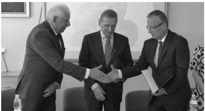
Objęcie patronatem powoduje, że „klasa policyjna”, z dniem 19 czerwca, zyskała miano „klasy akademickiej”