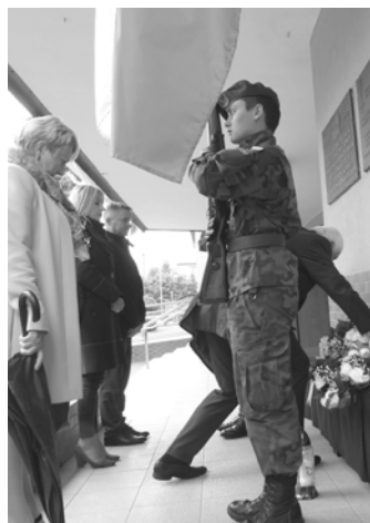
Uroczyste złożenie kwiatów