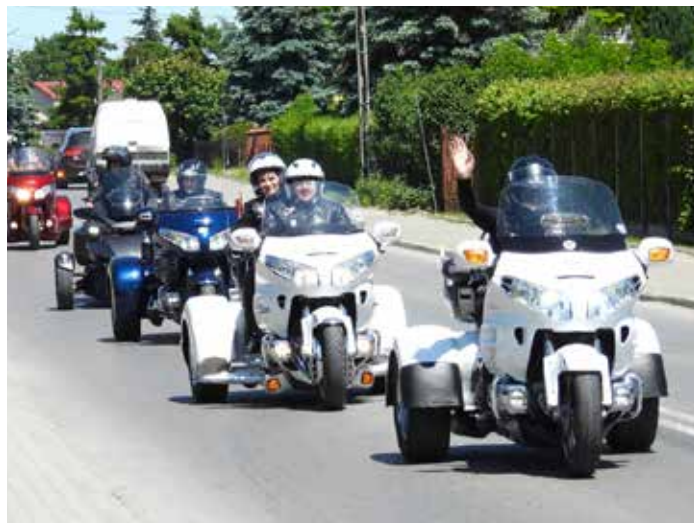
I MOTOALBERT, czyli Zlot Motocykli