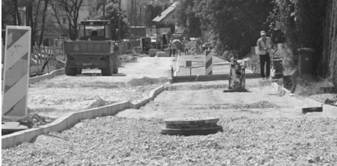
ul. Żytnia w przebudowie

Wiktora od firmy Piast w kierunku linii kolejowej oraz na budowie nowego odcinka drogi, która będzie przedłużeniem ul. ks. Ruczki. Łączna długość inwestycji to około 580 m. Odcinek będzie miał nawierzchnię z betonu asfaltowego, jednostronne ciągi pieszych oraz oświetlenie.