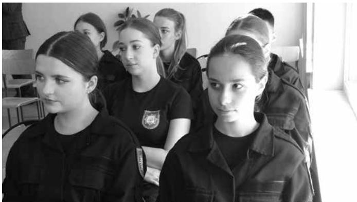
Młodzież z „klasy policyjnej” kolbuszowskiego Liceum