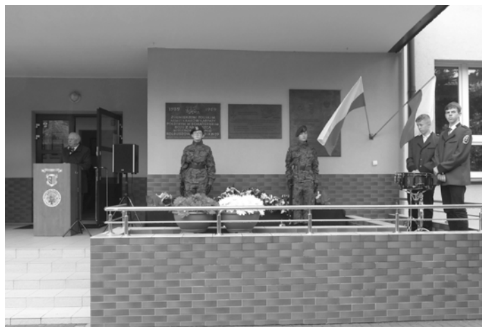
Starosta Kolbuszowski w swoim krótkim przemówieniu podkreślił, że tylko jedność i zgoda pozwoli na umocnienie siły w narodzie