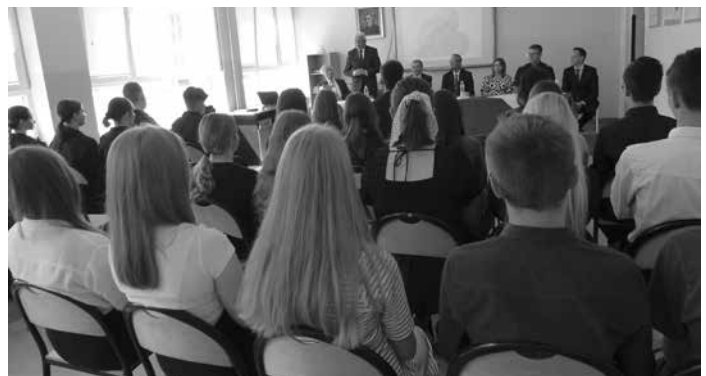
O swoim wsparciu w kierunku dalszego rozwoju „klasy policyjnej” zapewniał Starosta Kolbuszowski