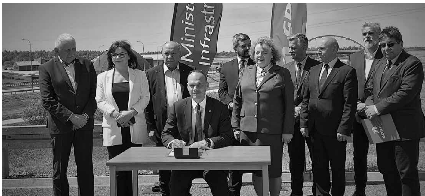
Moment podpisania Programu Inwestycji dla budowy nowego przebiegu drogi krajowej nr 9