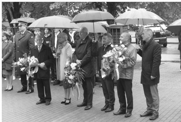
Uczestnicy obchodów 79. rocznicy bitwy pod Monte Cassino.

mniał kilka zdarzeń z historii, kiedy to Polska, nie raz, zawiodła się na zawartych sojuszach z innymi krajami. Zwrócił się do młodzieży, aby zawsze pamiętali o historii swojego