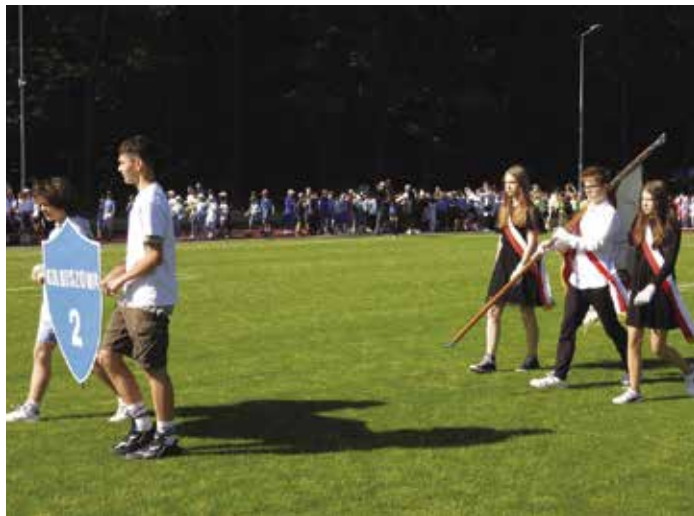
Święto patrona „Dwójki” – Kamiliada