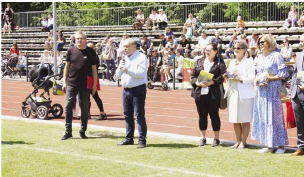
Sportowa Olimpiada Przedszkolaków