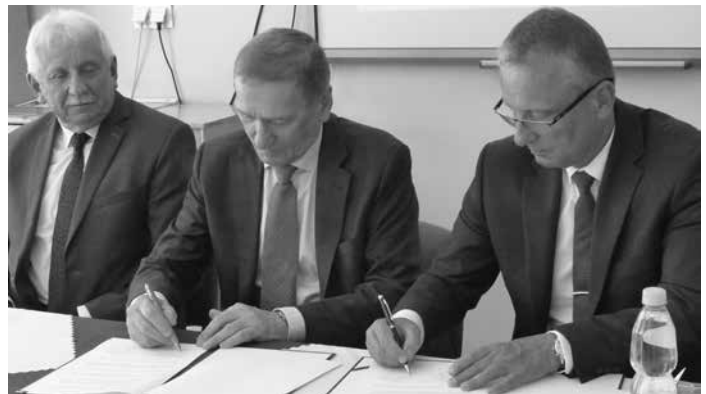
Podpisanie porozumienia w sprawie objęcia patronatem „klasy policyjnej” przez Wyższą Szkołę Prawa i Administracji Rzeszowską Szkołę Wyższą