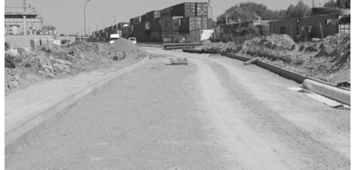
Nowy odcinek drogi będący przedłużeniem ul. Ruczki