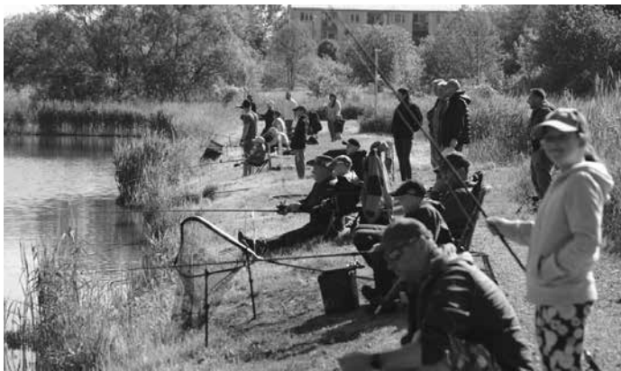
fol. Koło nr 17 w Kolbuszowej

Zwycięzcy zostali wyróżnieni nagrodami rzeczowymi zakupionymi przy wsparciu finansowym Gminy Kolbuszowa.