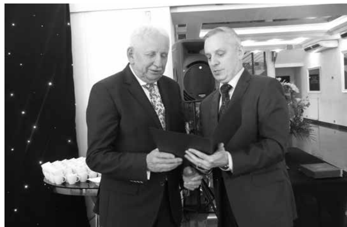
Przedstawiciel Kuratorium Oświaty Dariusz Kuraś oraz Starosta Kolbuszowski Józef Kardyś