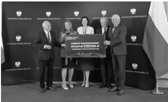
Pozyskane fundusze zostaną przeznaczone na remonty dróg powiatowych w gminie Cmolas oraz Niwiska

Rządowy Fundusz Rozwoju Dróg to kompleksowy instrument wsparcia realizacji zadań na drogach zarządzanych przez jednostki samorządu terytorialnego. Jego celem jest przyspieszenie powstawania nowoczesnej i bezpiecznej infrastruktury drogowej na szczeblu lokalnym, stanowiącej