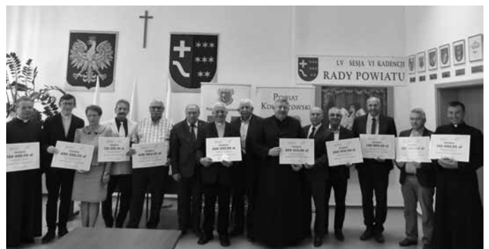
W sumie na renowację zabytków w powiecie kolbuszowskim trafi ponad 3,5 mln zł