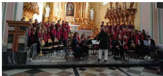
Zespoły szkolne: połączone chóry oraz zespół muzyki dawnej w Kościele pw. Wszystkich Świętych