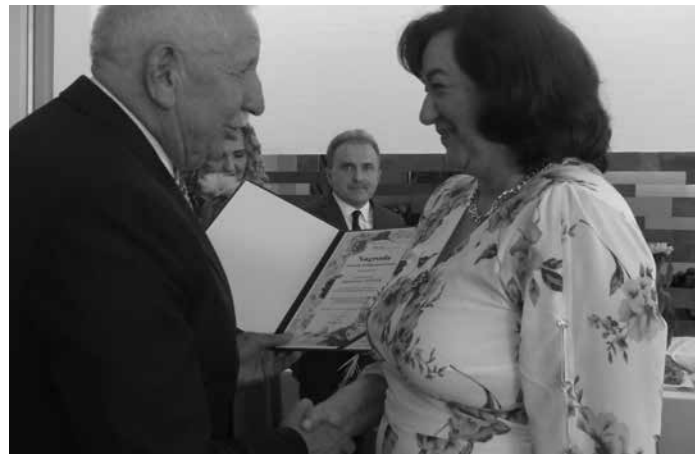
Starosta Kolbuszowski wręcza nagrody dla szczególnie wyróżniających się pracowników