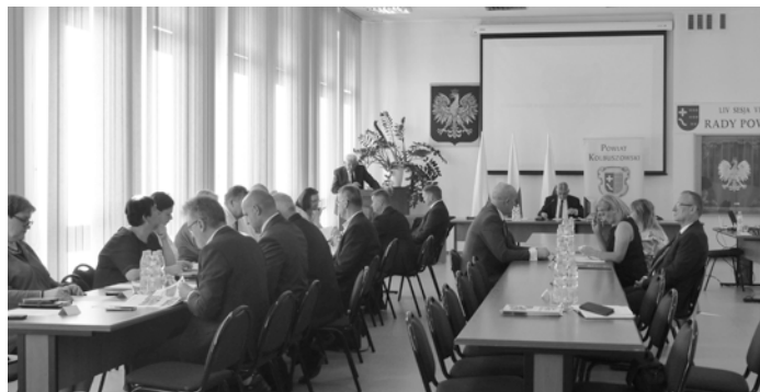
Radni, większością głosów, zajęli stanowisko podczas Sesji Rady Powiatu, jaka odbyła się 8 września, w Starostwie Powiatowym w Kolbuszowej.

gać się jednoznacznego przyjęcia przez Rząd Republiki Federalnej Niemiec odpowiedzialności moralnej, politycznej, historycznej, prawnej oraz finansowej za zniszczenia. Rada Powiatu w Kolbuszowej oczekuje od Rządu Rzeczypospolitej Polskiej stanowczego prowadzenia działań dyplomatycznych i prawnych, zmierzających do uzyskania od Rządu Republiki Federalnej Niemiec