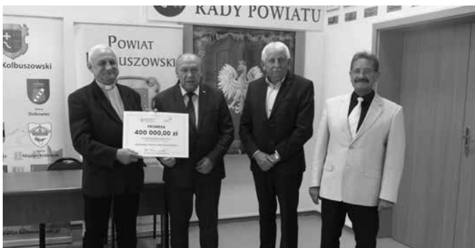
Na wykonanie prac budowlano-konserwatorskich w zabytkowym drewnianym kościele pw. św. Anny w Trzęsówce pozyskano 400 tys. zł.