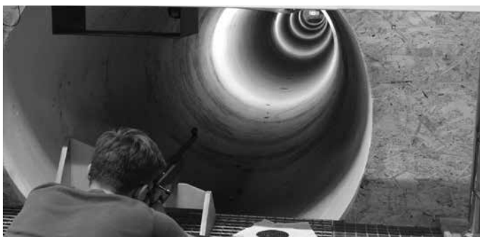
W powiecie kolbuszowskim znajduje się również nowo przebudowana strzelnica

Mimo wielu sukcesów nie zwalniamy tempa i jesteśmy przygotowani do realizacji kolejnych zadań, na które na ten rok mamy zaplanowane ponad 60 milionów złotych. - Mamy bardzo ambitne cele na 2024 rok i dołożymy wszelkich starań, abyśmy mogli je zrealizować – podkreśla Starosta Kolbuszowski.