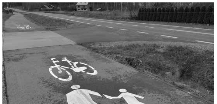
Ścieżka pieszo-rowerowa w Komorowie służy wszystkim miłośnikom aktywnego wypoczynku na świeżym powietrzu