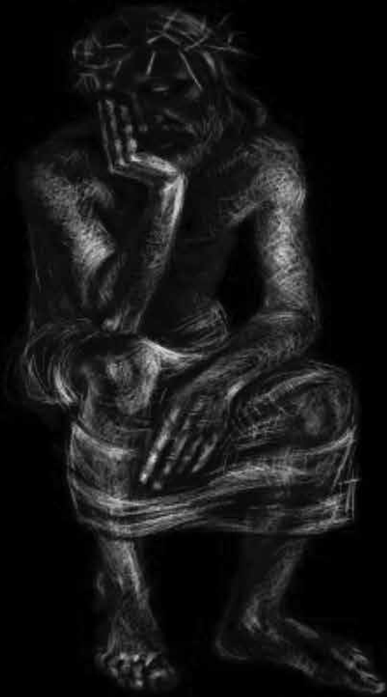
rys. Urszula Strajny-Bronikawska