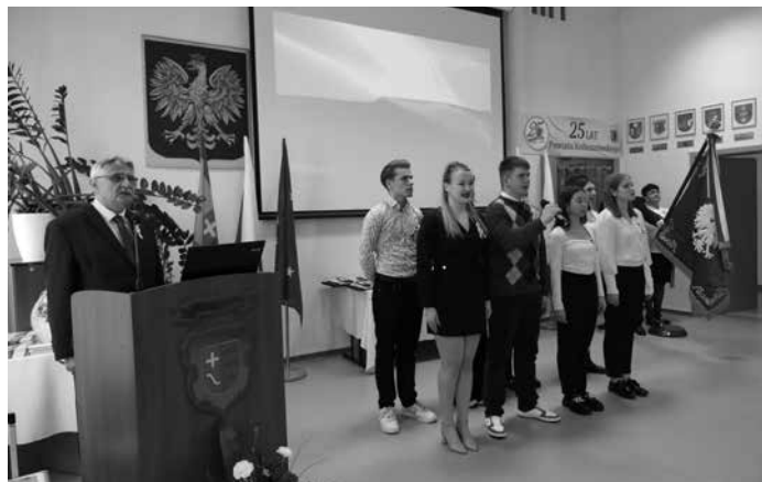
Odśpiewanie hymnu narodowego

Szef Powiatu zaznaczył, że prawdziwy rozkwit nastąpił w szkolnictwie ponadpodstawowym, na którego rozwój wydatkowanych zostało ponad 40 milionów złotych. Za tą kwotą kryją się zadania, wpływające na rozwój bazy sportowej i dydaktycznej naszych szkół, ale także poprawiające ich funkcjonowanie.