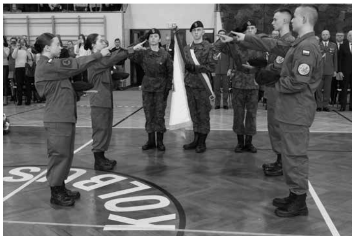
Uroczyste ślubowanie kadetów