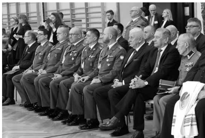
W uroczystości udział wzięli zaproszeni goście