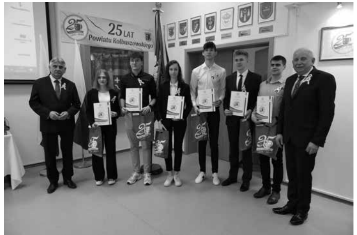
Laureaci Powiatowego Konkursu "Zostaję w powiecie kolbuszowskim"