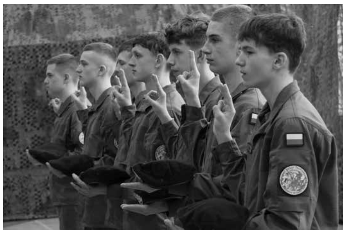
Kadeci Oddziału Przygotowania Wojskowego Zespołu Szkół Technicznych w Kolbuszowej