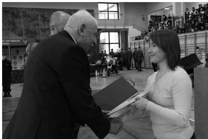
Podziękowania dla rodziców