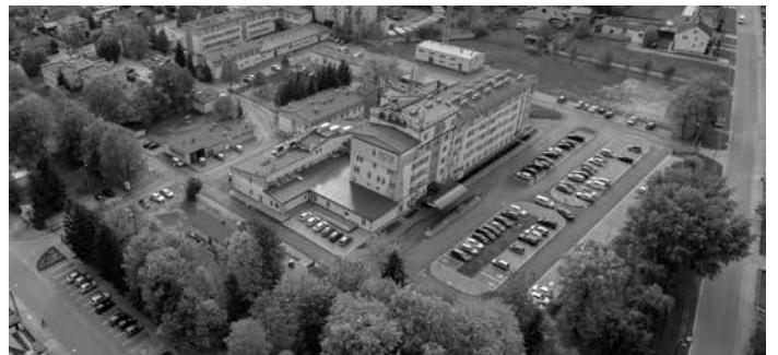
W Szpitalu Powiatowym w Kolbuszowej reaktywowany został Oddział Chorób Wewnętrznych

Mając na uwadze, że mieszkańcy cenią sobie aktywny wypoczynek i ruch na świeżym powietrzu, w po-