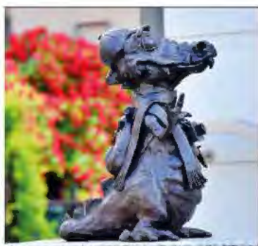
PRZY ODDZIALE MIPBP