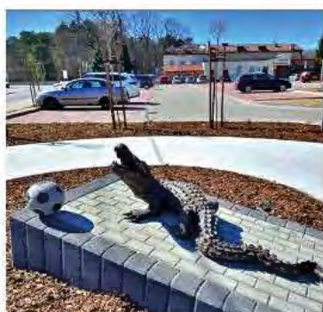
PRZY STADIONIE MIEJSKIM