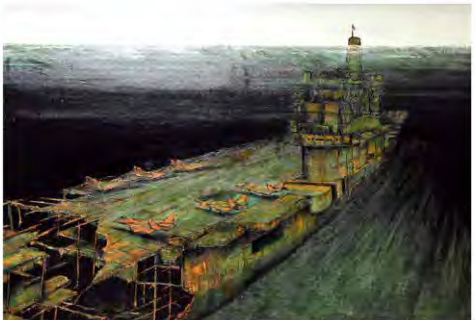
Zniszczony i zatopiony lotniskowiec z samolotami na pokładzie. Przykład destrukcji i upadku kosztownej techniki wojennej. Czy w takim kierunku zmierza nasza cywilizacja?