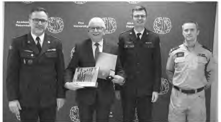
W szkoleniach z zakresu ochrony ludności oraz obrony cywilnej udział wzięli starostowie oraz prezydenci miast na prawach powiatu

*Podmioty ochrony ludności to wszystkie osoby, organizacje i insty-