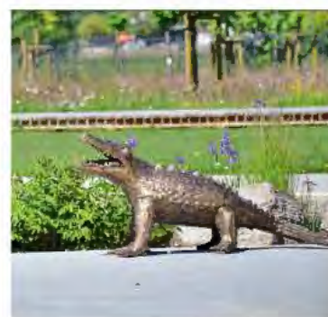
W PARKU NIEPODLEGŁOŚCI