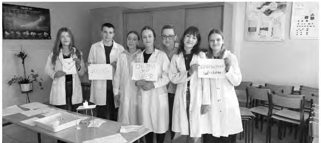
W liceum uczniowie brali udział w zajęciach i doświadczeniach chemicznych