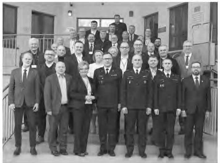
Uczestnicy marcowych Wyższych Kursów Ochrony Ludności

tucje, które będą świadczyć pomoc w sytuacji zagrożenia. Są to m.in.: jednostki organizacyjne Państwowej Straży Pożarnej; ochotnicze straże pożarne; inspekcje i stráže, tj. m.in.: