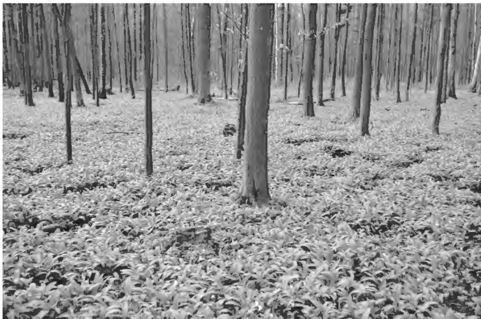
Rozległe zielone kobierce czosnku niedźwiedziego w lesie Morgi Kamięskie. Marzec 2024 r.