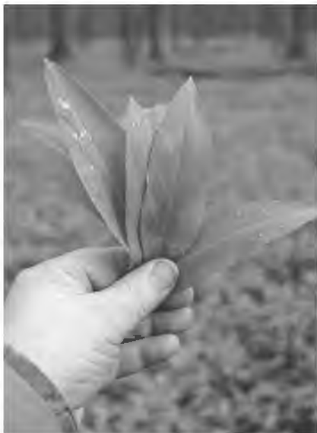
Liście czosnku niedźwiedziego zerwane po ustąpieniu porannej mgły.