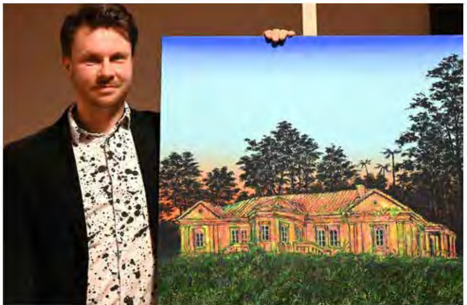
Artysta przy swym dziele prezentującym dwór w Dzikowcu, w bliżej nieokreślonej przyszłości. Warto zwrócić uwagę na fakt, że dzieła jego taty odnoszą się do przeszłości.

Jak już zostało wyżej wspomniane zajmuje się on malarstwem sztalugowym, w stylu nowoczesnym. Ale nie abstrakcyjnym, kubistycznym, ekspresjonistycznym, czy tzw. „szokującym”. Wręcz przeciwnie. Jego dzieła przedstawiają bardzo wyraziste kształty krajobrazów, budynków, okrętów,