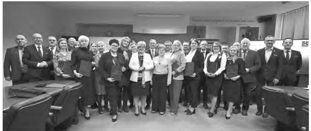
Zespół Szkół Technicznych w Kolbuszowej oraz Liceum Ogólnokształcące w Kolbuszowej dołączyły do prestiżowego programu edukacyjnego, organizowanego przez WSPiA Rzeszowską Szkołę Wyższą we współpracy z Podkarpackim Kuratorium Oświaty.

kresie odpowiedzialności prawnej i przeciwdziałania patologiom społecznym.