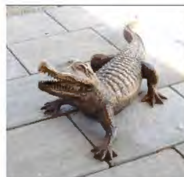
PRZY DOMU SENIORA NA BULWARACH