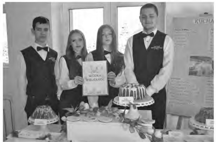
Młodzież z Weryni kusiła młodszych kolegów słodkimi wypiekami