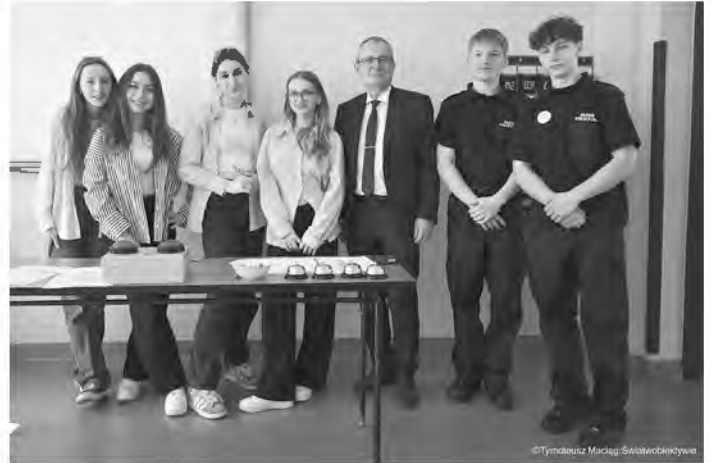
„Aktywna Środa” w Liceum Ogólnokształcącym w Kolbuszowej

nicznych im. Bohaterów Września 1939 r. w Kolbuszowej zaprezentowały swoje nowoczesne zaplecze edukacyjne i sportowe. Uczniowie mogli porozmawiać ze starszymi kolegami, zobaczyć bogato wyposażone klasopracownie i dowiedzieć się więcej o kierunkach kształcenia. – Ta inicjatywa daje młodym ludziom szansę, by zobaczyli na własne oczy, co oferują nasze szkoły. Chcemy, aby podjęli świadomą decyzję o swojej przyszłości – podkreśla Starosta Kolbuszowski Józef Kardyś. – Cieszy nas tak duża frekwencja - dodaje.