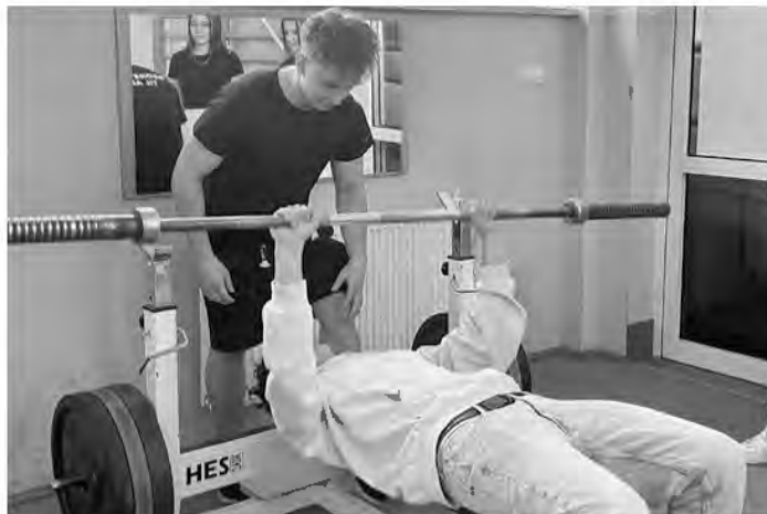
Zajęcia na siłowni cieszyły się dużym zainteresowaniem