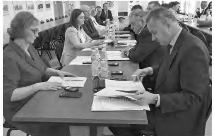
Podczas marcowej Sesji Rady Powiatu radni podjęli kilka ważnych uchwał, zapoznali się również z informacją, dotyczącą stanu bezpieczeństwa sanitarnego w powiecie