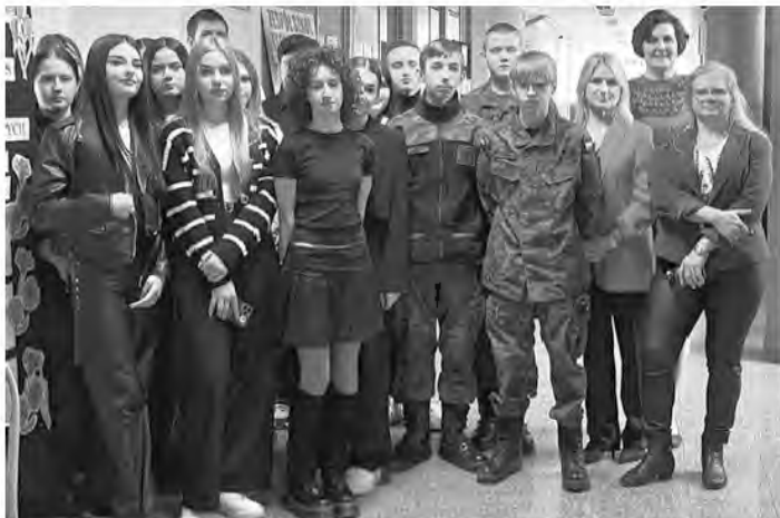
Młodzież Zespołu Szkół Technicznych serdecznie przywitała swoich młodszych kolegów ze szkół podstawowych