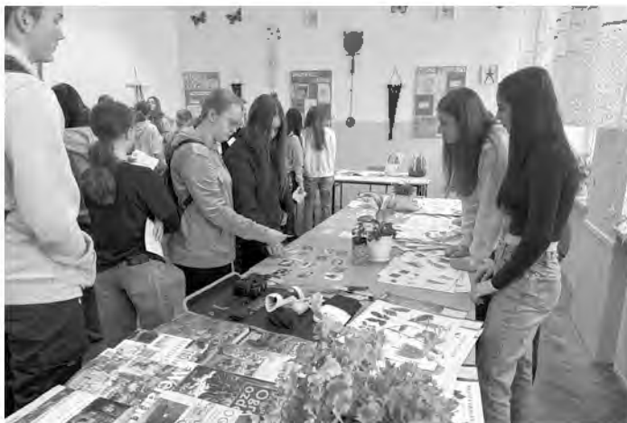
Uczniowie ze szkół podstawowych w Zespole Szkół Agrotechniczno-Ekonomicznych w Weryni