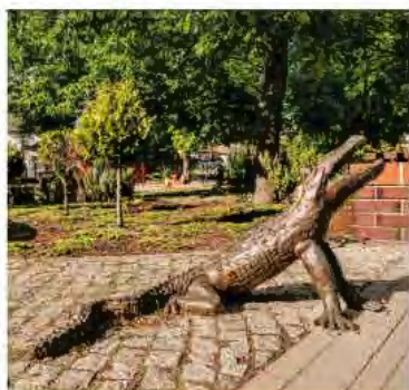
PRZY UL. PARKOWEJ