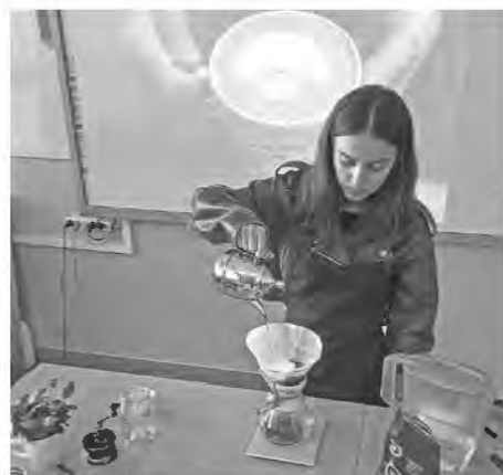
Młodzi bariści z Zespołu Szkół Technicznych w akcji